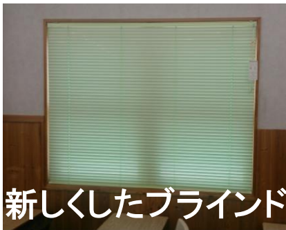
新しくしたブラインド